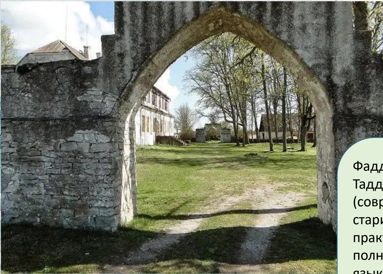
Усадьба Фаддея Беллинсгаузена на острове Сааремаа

Фаддей Беллинсгаузен (имя при рождении Фабиан Готтлиб Таддеус фон Беллинсгаузен) родился на острове Эзель (современный Сааремаа, Эстония) и принадлежал к старинному остзейскому роду. Интересно, что в детстве он практически не говорил по-русски, а впоследствии почти полностью забыл изначально родной для него немецкий язык. В десятилетнем возрасте мальчика определили в Морской кадетский корпус, который он закончил в 1797 году, получив чин мичмана и назначение в Ревельскую эскадру на Балтике.