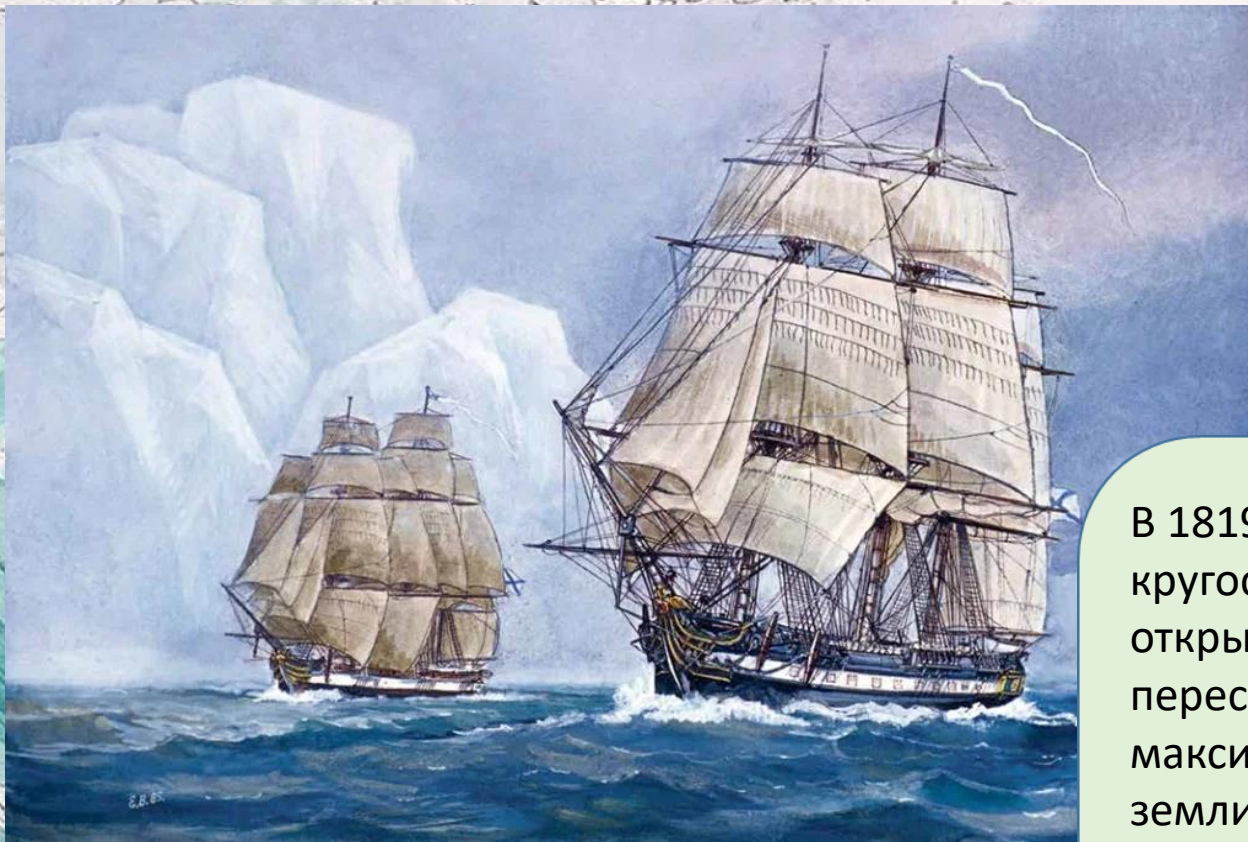
Е.В.Войшвилло, Б.М.Стародубцев «Шлюпы «Восток» и «Мирный»

В 1819 году Ф. Беллинсгаузен возглавил морскую кругосветную экспедицию, в результате которой была открыта Антарктида. Основной задачей экспедиции было пересечь все меридианы в южной приполярной зоне на максимальных широтах, выяснить, существуют ли там земли, и, по возможности, пройти к Южному полюсу. Ф. Ф. Беллинсгаузен командовал шлюпом «Восток», а М. П. Лазарев – шлюпом «Мирный». 4 июля 1819 года корабли покинули Кронштадт и взяли курс к Южному полюсу.